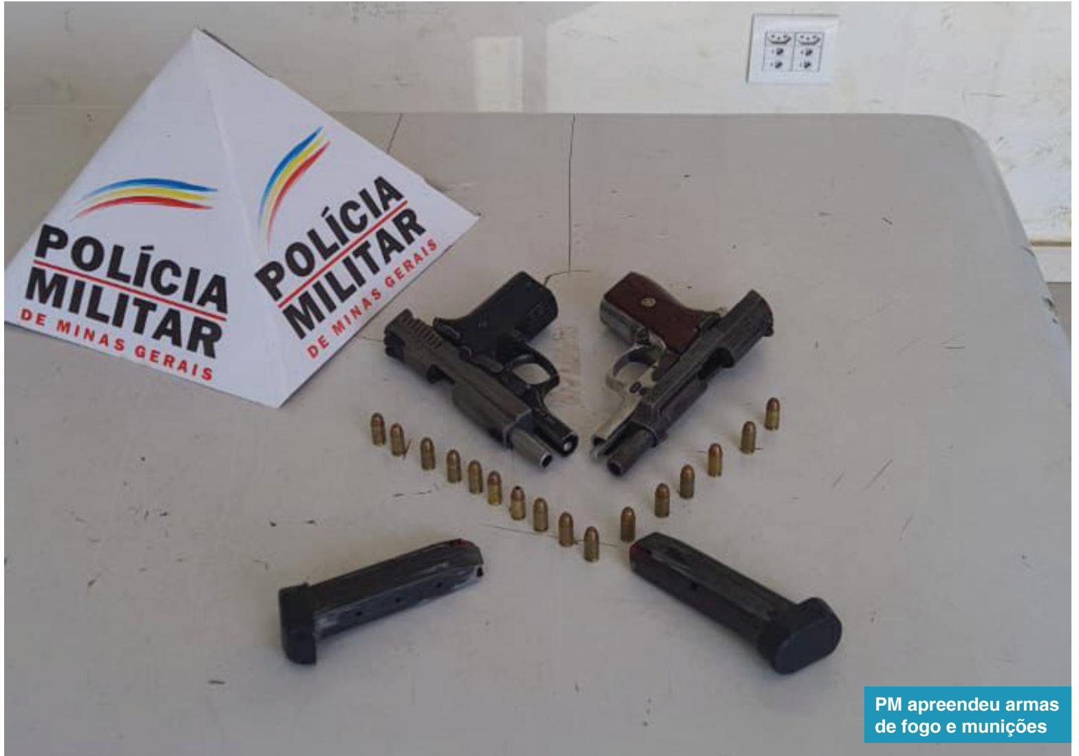
PM apreendeu armas de fogo e munições